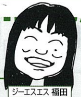
ジーエスエス 福田

イベントが多くなるこの時期、ケガをする確率も増えます。特に子供や高齢者が参加するイベントには、ぜひレクリエーション保険の加入をおすすめします!