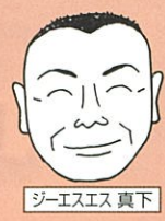
ジーエスエス 真下