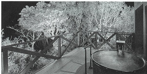
〈写真はイメージです〉

▲ 群馬県庁生協専用ページからもご予約可能です。 ● 受付時間 9:00~18:00