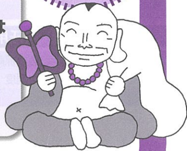
☆福神シリーズ 布袋尊