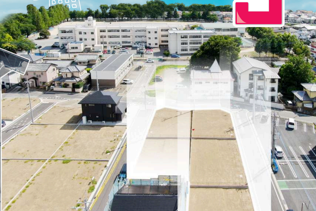
写真は現地(2023.7月撮影)です。