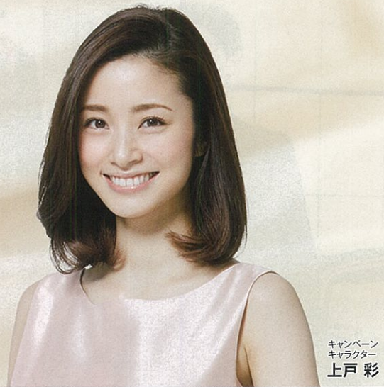
キャンペーン キャラクター 上戸 彩

本紙クーポン券をお持ちで スーツ・礼服・コートが 特別価格でお求めいただけます。